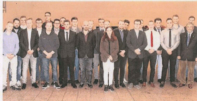
Bereit für den Start ins Berufsleben: Die freigesprochenen Kraftfahrzeugmechaniker.