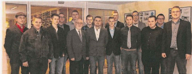
Die jungen Gesellen der Innung Sanitär-Heizung-Klima und Klempner.