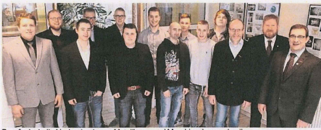
Berufsstart: die frischgebackenen Metallbauer und Maschinenbaumechaniker.

RENSBURG Im Rendsburger Haus des Handwerks nahmen die jungen Metallbauer und Maschinenbaumechaniker vor Kurzem ihre Gesellenbriefe entgegen. Fachrichtung Konstruktionstechnik, Innung Rendsburg: